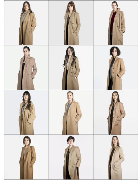
135. Cappuccio Girls - Milano 2011