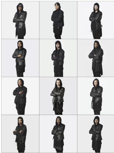
140. Ohno - Amsterdam 2014