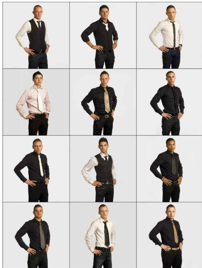
Limburgse 'Vips', 2009.

Versuz. „Een heel interessante subcultuur — er zijn zelfs codes van wat je wel en niet mag dragen in zo'n discotheek. Je ziet er ook alles door elkaar: Vlamingen en Walen, ze komen allemaal naar de Versuz. Maar het is wel verschrikkelijk voor ons om de hele nacht in die klotehier te werken ( lacht ).”