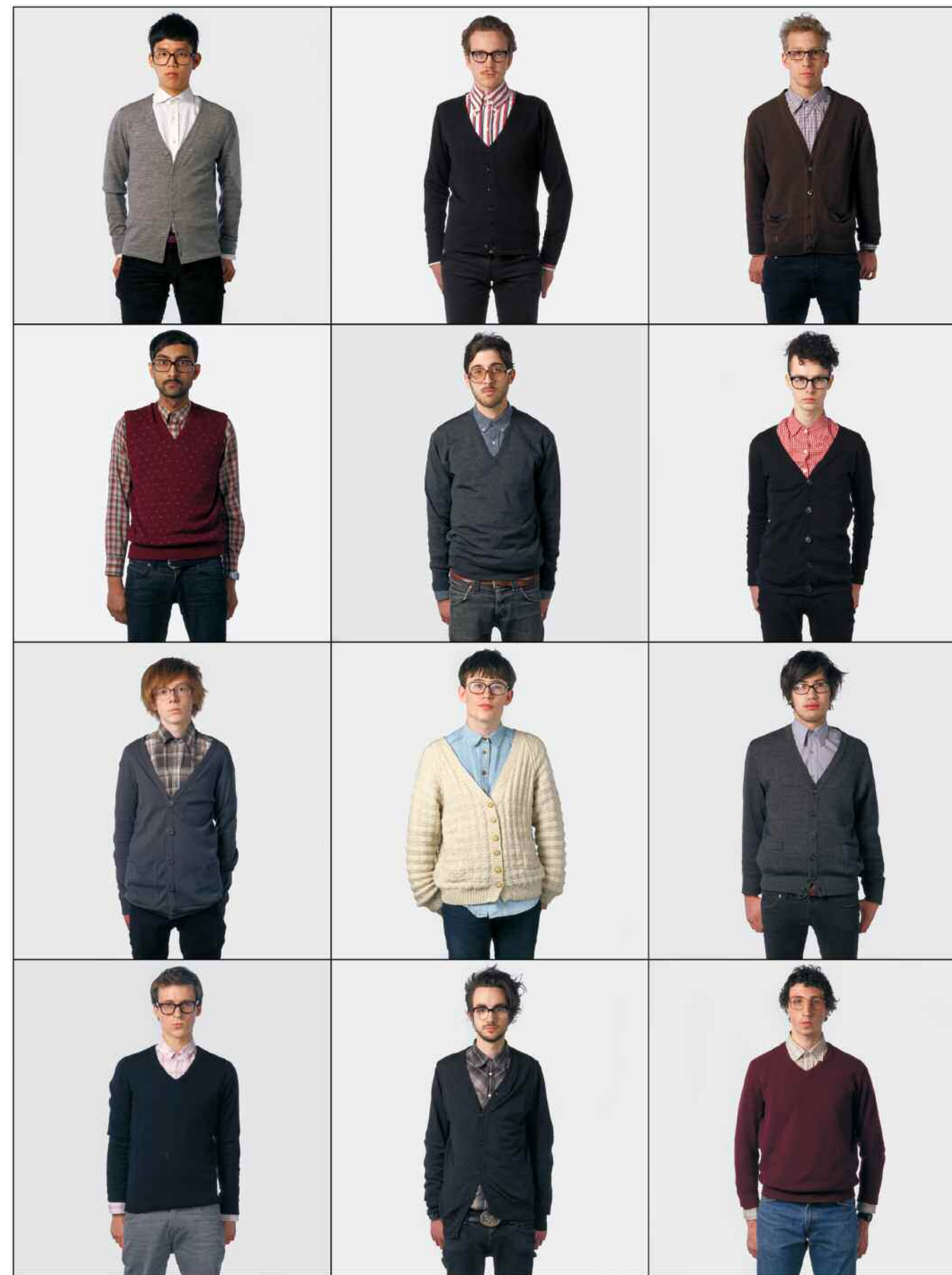
Londense 'Geeks', 2008.

Eenvoudig gezegd: Versluis en Uyttenbroek documenteren sinds 1994 subculturen — of stammen — in het straatbeeld. Ze noemen hun series Exactitudes , een samentrekking van exact en attitudes . Deze maand komt de vijfde editie van hun boek, een work in progress dat de series — ruim over de honderd ondertussen — bundelt. „Het is begonnen met een opdracht in 1994 om enkele subculturen in Rotterdam in beeld te brengen”, zegt Uyttenbroek. „De gabbers waren toen een grote scene in Rotterdam. Maar toen we al die foto's van gabbers naast elkaar zagen liggen, kwam er iets tevoorschijn wat de afzonderlijke foto's oversteeg.” „Je kunt wel foto's maken van gabbers,” vult Versluis aan, „maar pas als je al die koppen naast elkaar legt en al die blikken ziet, snap je echt hoe zo'n cultuur eruitziet. Daar is het idee ontstaan. →