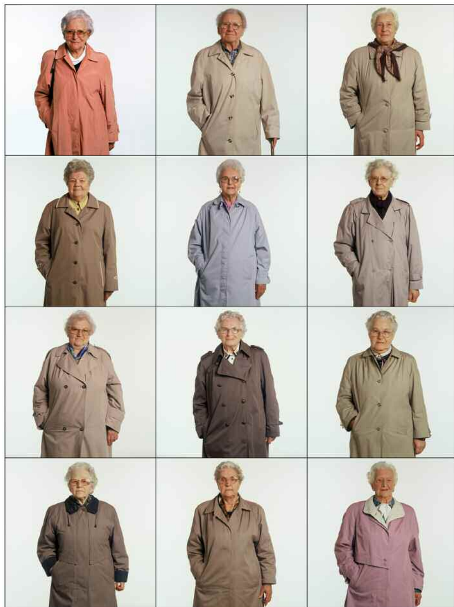
Rotterdamse 'Grannies', 1998.

hun studio — thuis in Rotterdam of op locatie — voor een shoot voor een witte muur. Een mix tussen de esthetiek van een pasfoto en een intiem portret. Belangrijk: hun kleding wordt niet gestyled. „Op het moment dat je gaat stylen, kom je heel dicht in de buurt van een modereportage, en dat is net wat we niet willen,” zegt Versluis. „Het gaat niet om wat de mode dicteert, het gaat om identiteit. Dan moet je mensen zichzelf laten zijn.” Wordt wel bijgestuurd: de pose. Iedereen staat op dezelfde, kenmerkende manier op de foto. Alle Bouncers , buitenwippers in de Rotterdamse discotheken, staan lichtjes gespreid met hun benen, handen gekruist ter hoogte van hun middel. De Japanse fashionista's poseren dan weer als brave