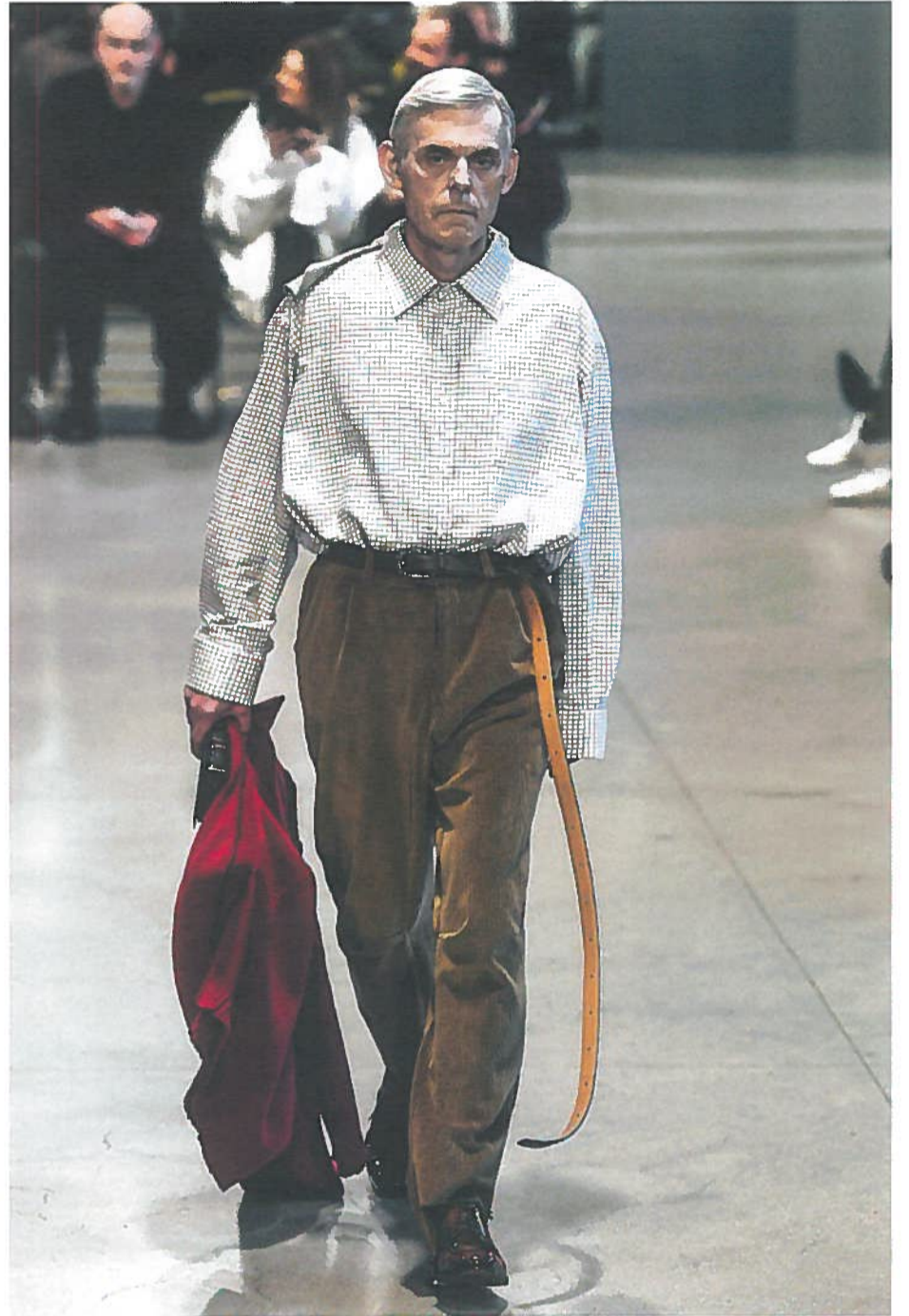
Links: Exactitude 67: Early Birds , Rotterdam 2005. Rechts de interpretatie van Vetements-ontwerper Demna Gvasalia, met net iets andere volumes, zoals langere mouwen en een lange riem.

Magazine. Versluis: „Hij vertelde hoe belangrijk onze Exactitudes tijdens zijn studententijd voor hem waren geweest. Dresscodes interesseerden hem zeer.”