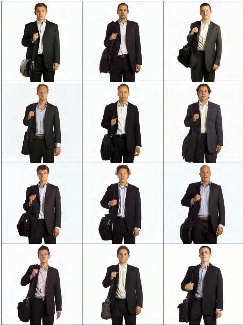
105. Flexmanagers – Rotterdam/Paris 2008