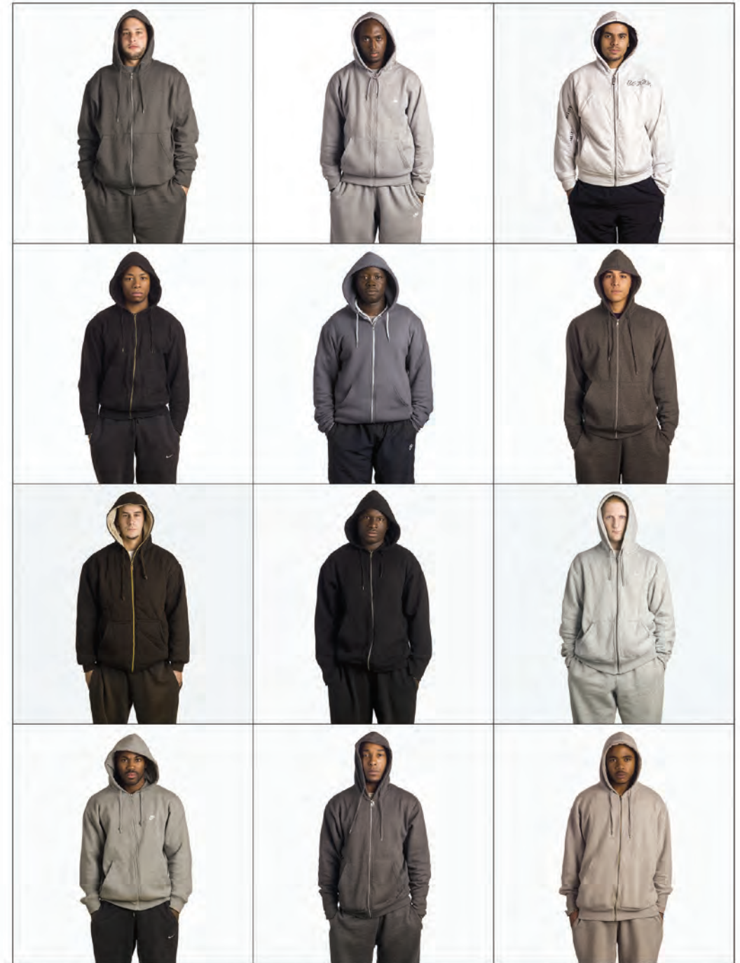
124. The Invisible Men - Evry 2009

En 1994, el fotógrafo Ari Versluis y la estilista Ellie Uyttenbroek iniciaron en las calles de Rotterdam un work in progress . Se trata de un registro de más de tres mil tipos sociales esmeradamente diferenciados por medio de una colección de características visuales compartidas que relaciona a los individuos retratados con tipos sociales específicos: Gabbers , Glamboths , Mohawks , Rockers o Las Chicas de Ipanema . El agudo ojo y una estricta metodología permite discernir códigos específicos de vestido aunados a actitudes que caracterizan a las tribus urbanas y las subculturas contemporáneas. Su práctica descansa en la semiótica de los objetos culturales que, combinados, producen los signos y los lenguajes en las que los hábitos sociales son expresados a la par de las formas en las que estas culturas, subculturas y tipologías urbanas producen, estabilizan y diseminan significado en la arena social. Esta suerte de experimento sociológico recuerda las tipologías de ilustraciones hechas por naturalistas del siglo XIX para categorizar especímenes en el intento por reflejar nuestro deseo de autenticidad que, por irónico que resulte, también empata con la necesidad de pertenecer a grupos sociales específicos. MARÍA PAZ AMARO