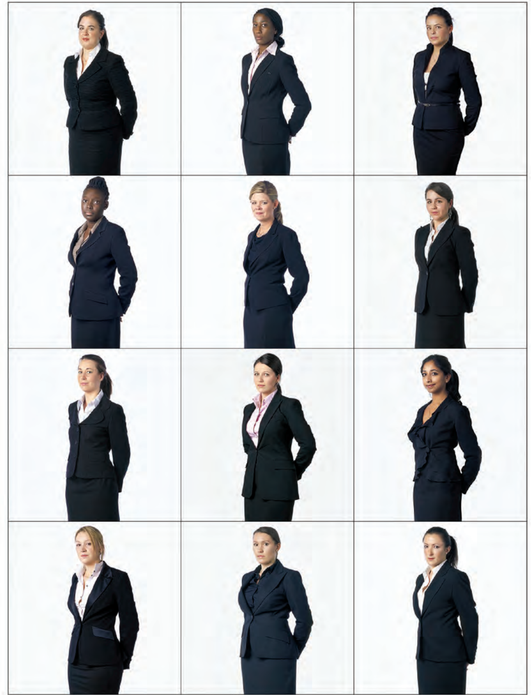
095. City Girls – London 2008