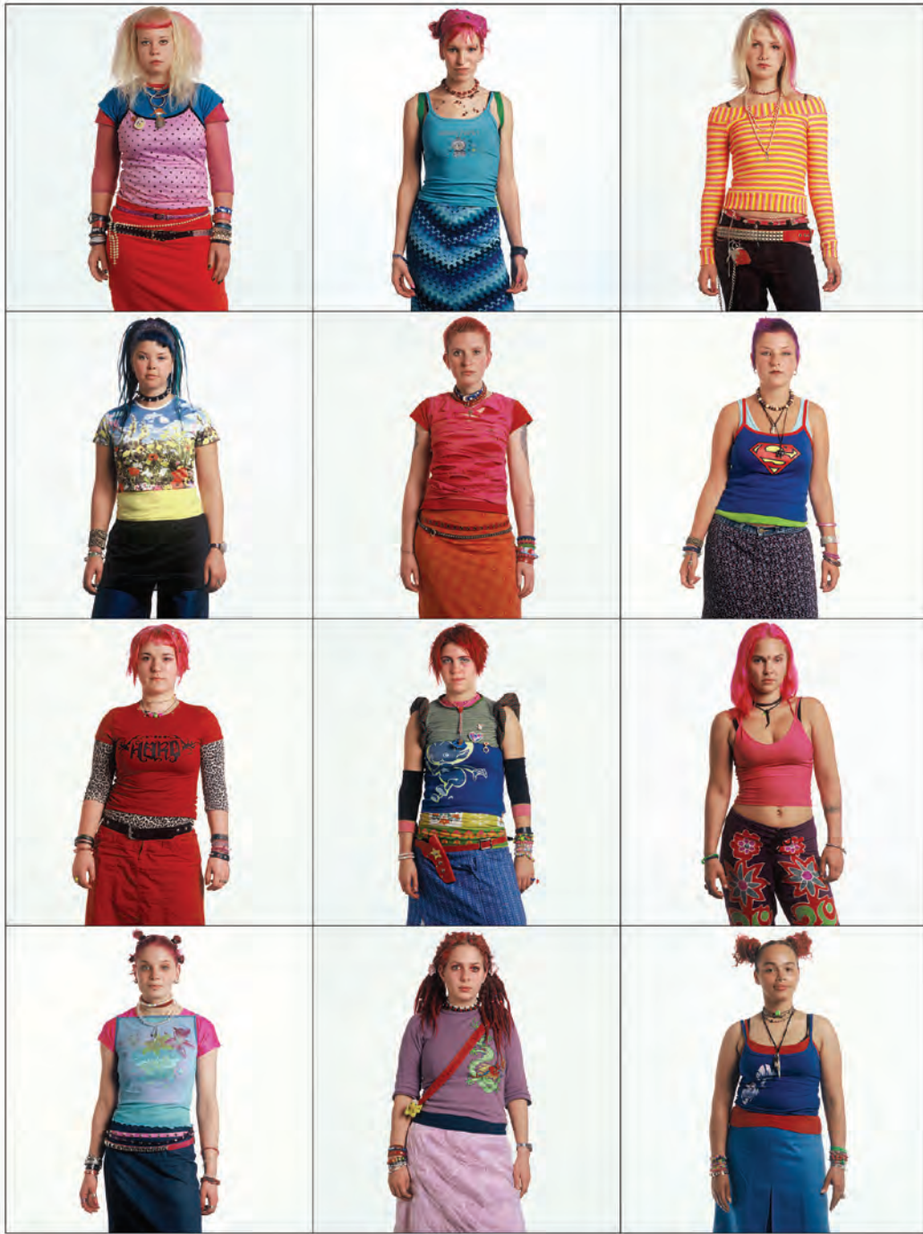
049. Teknohippies – Rotterdam 2001