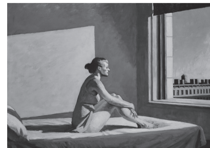
Morning Sun, 1952 (Edward Hopper)

De mens komt wel meer voor problemen te staan als hij het natuurlijke verloop van de dingen naar zijn hand wil zetten. Dat wilde de Griekse tragedie-dichter in de oudheid ook al aantonen; elke mythe ging altijd weer over wat de mens dacht te moeten doen om het verloop in eigen handen te nemen, met alle kwalijke gevolgen van dien. Het begrip „tragedie” verwijst trouwens naar die impact - de traagheid.