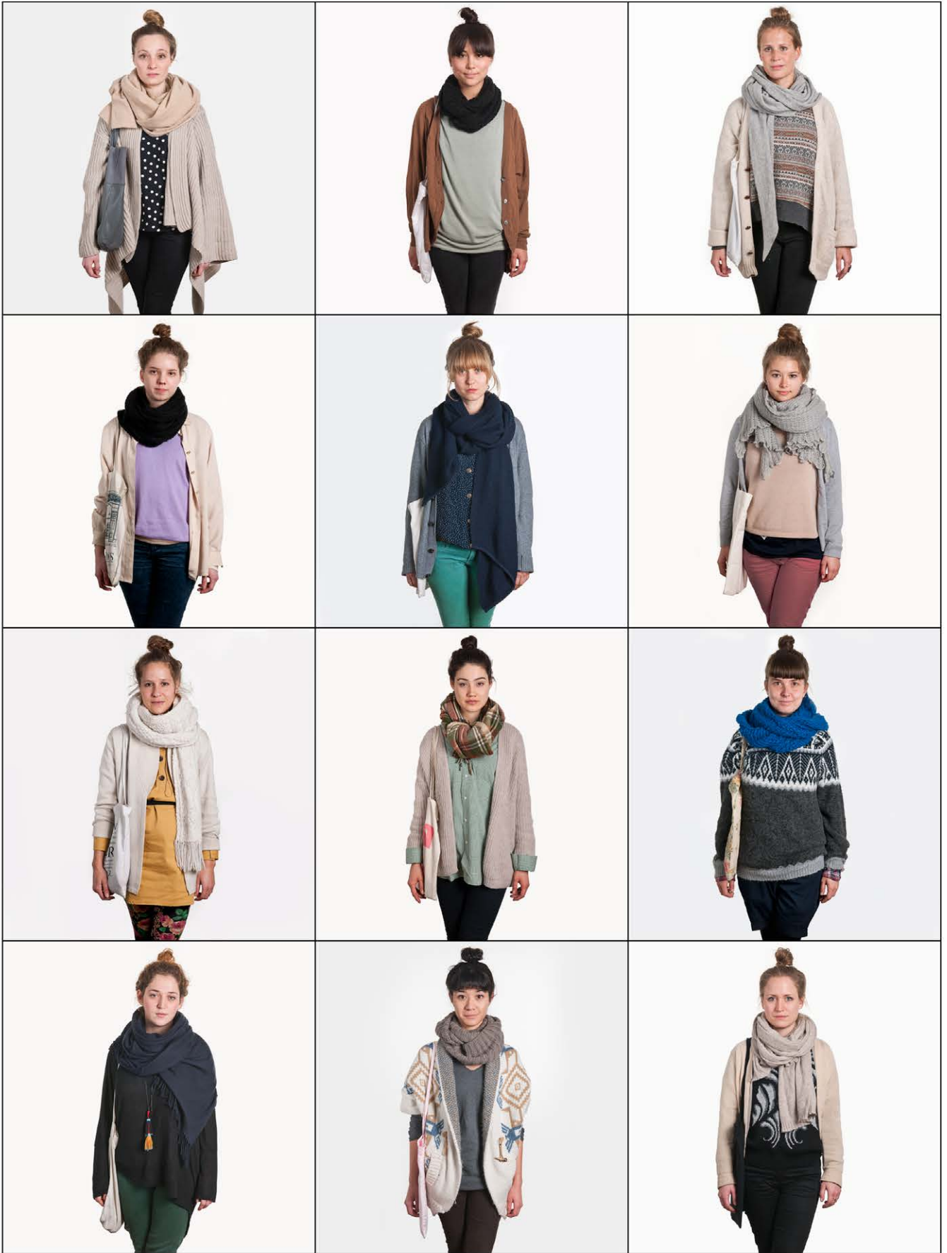
137. Veggies - Zürich 2012