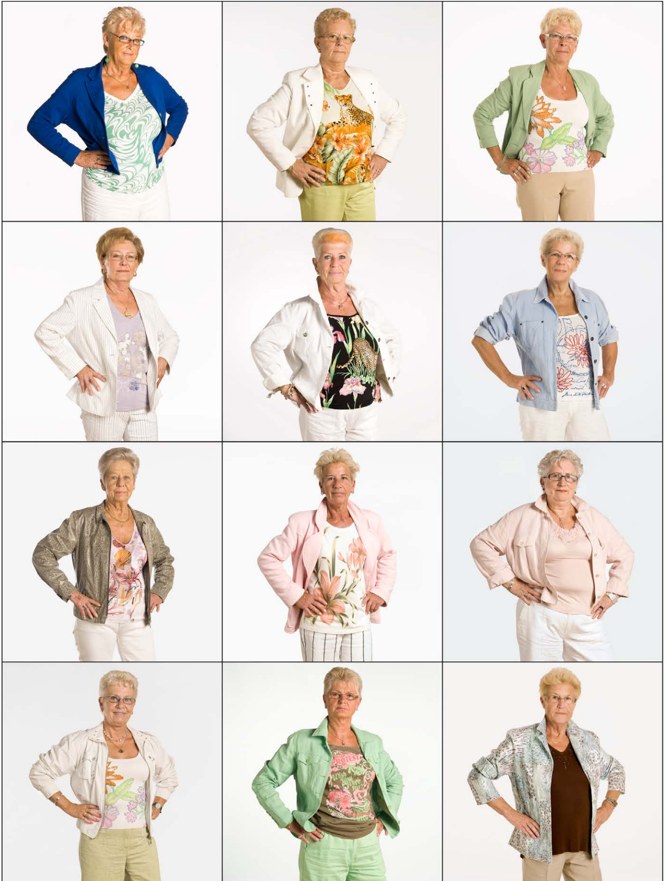
127. Aunite Never Ever - Rotterdam 2010